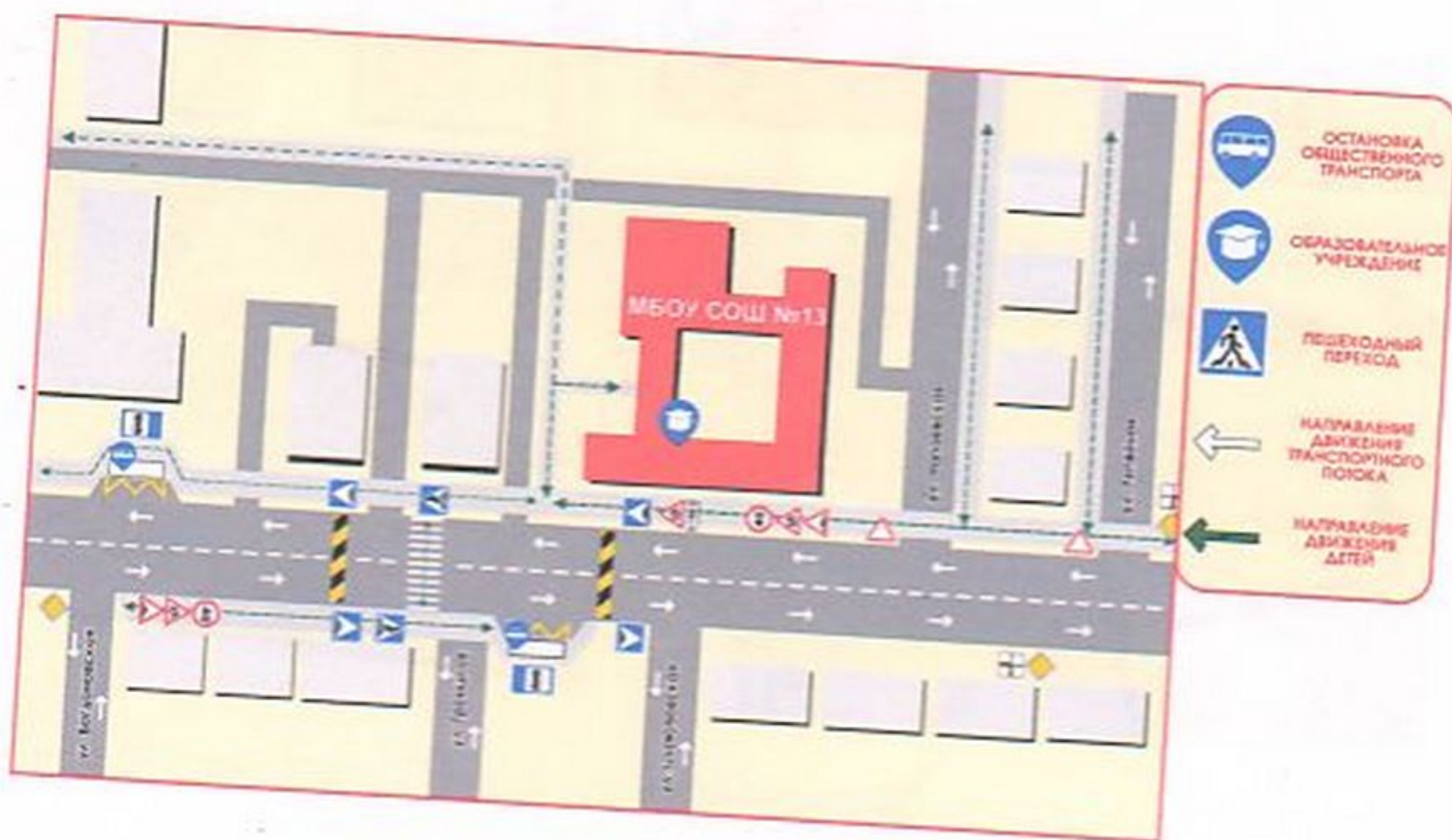
Схема движения детей и транспортных средств (здание по ул. Володарского, д.14)